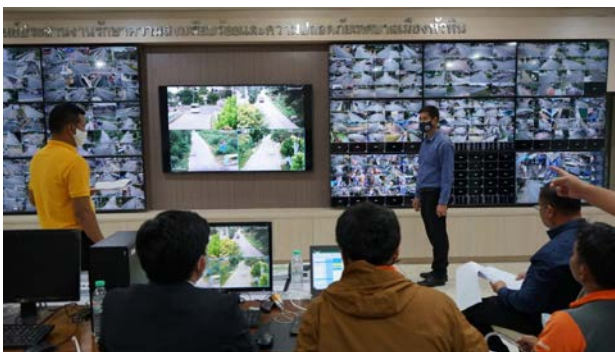
(ทม.หัวหิน-ติดตั้งCCTV)