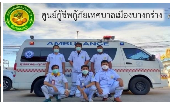
(ทม.บางกร่าง-เตรียมความพร้อมรถฉุกเฉิน)