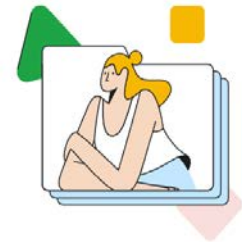
วางไฟล์ตรงนี้ หรือใช้ปุ่ม “ใหม่”