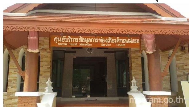
(ทต.แม่แรม-ตั้งศูนย์บริการนักท่องเที่ยว)