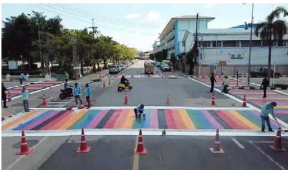
(ทน.อุบลราชธานี-ปรับปรุงทางม้าลาย)